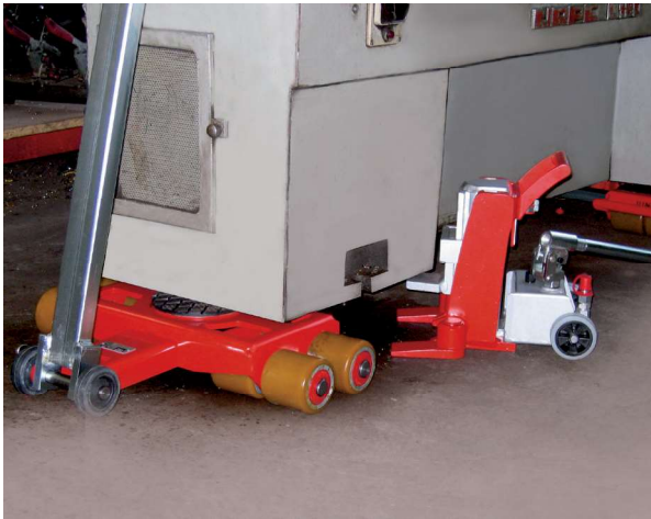
Les galets avec des roulements à billes garantissent un déplacement facile.